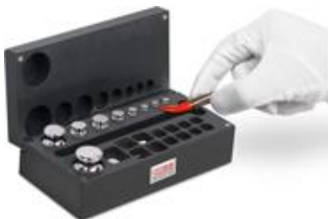
WSE2M100 (1 mg ... 100 mg)