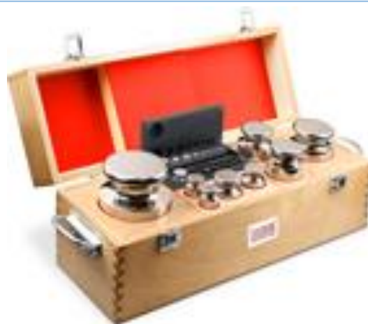
WSE2MK10 (1 mg ... 10 kg)